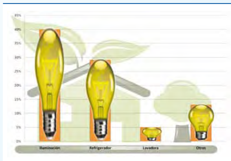
Figura 1. Consumos aproximados promedio de aparatos eléctricos por hogar.

La supervisión funcional continua de los electrodomésticos es una acción adicional para la optimización del consumo eléctrico en el hogar, ya que a partir del análisis estadístico de eventos funcionales del electrodoméstico (ciclos de apertura/cierre de puertas, ciclo de trabajo del compresor del refrigerador, etc.) es posible detectar anomalías o condiciones de operación, que pudieran provocar incrementos anormales en el consumo eléctrico. Apoyando esta supervisión con la verificación continua del consumo eléctrico total de los hogares es posible hacer aún más eficiente el uso de la energía.