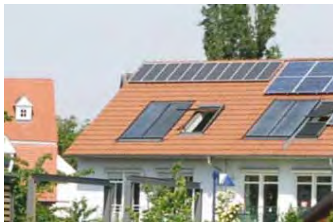
Figura 2. Paneles solares en casa habitación.

Grupo de fuentes de energía que se pueden conectar a la red principal, pero que pueden funcionar en forma autónoma. Fuentes renovables como solar y viento, microturbinas, celdas de combustible, esquemas de cogeneración y tecnologías de almacenamiento.