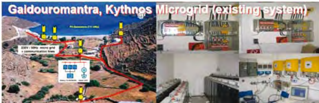
Figura 3. Uno de los ejemplos de microrredes en operación, en Grecia.